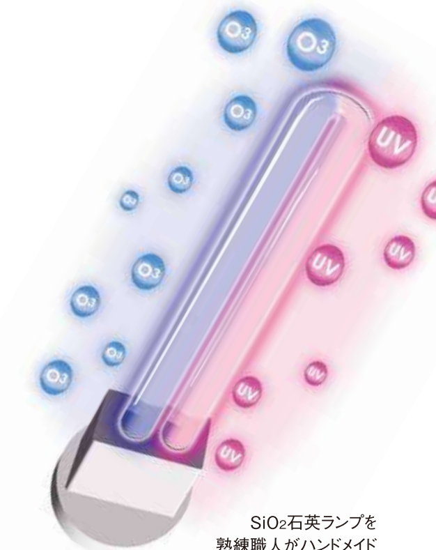
SiO 2 石英ランプを 熟練職人がハンドメイド

UV-C(波長 253.7 nm) OZONE(波長184.9nm)の ダブルで消臭&除菌